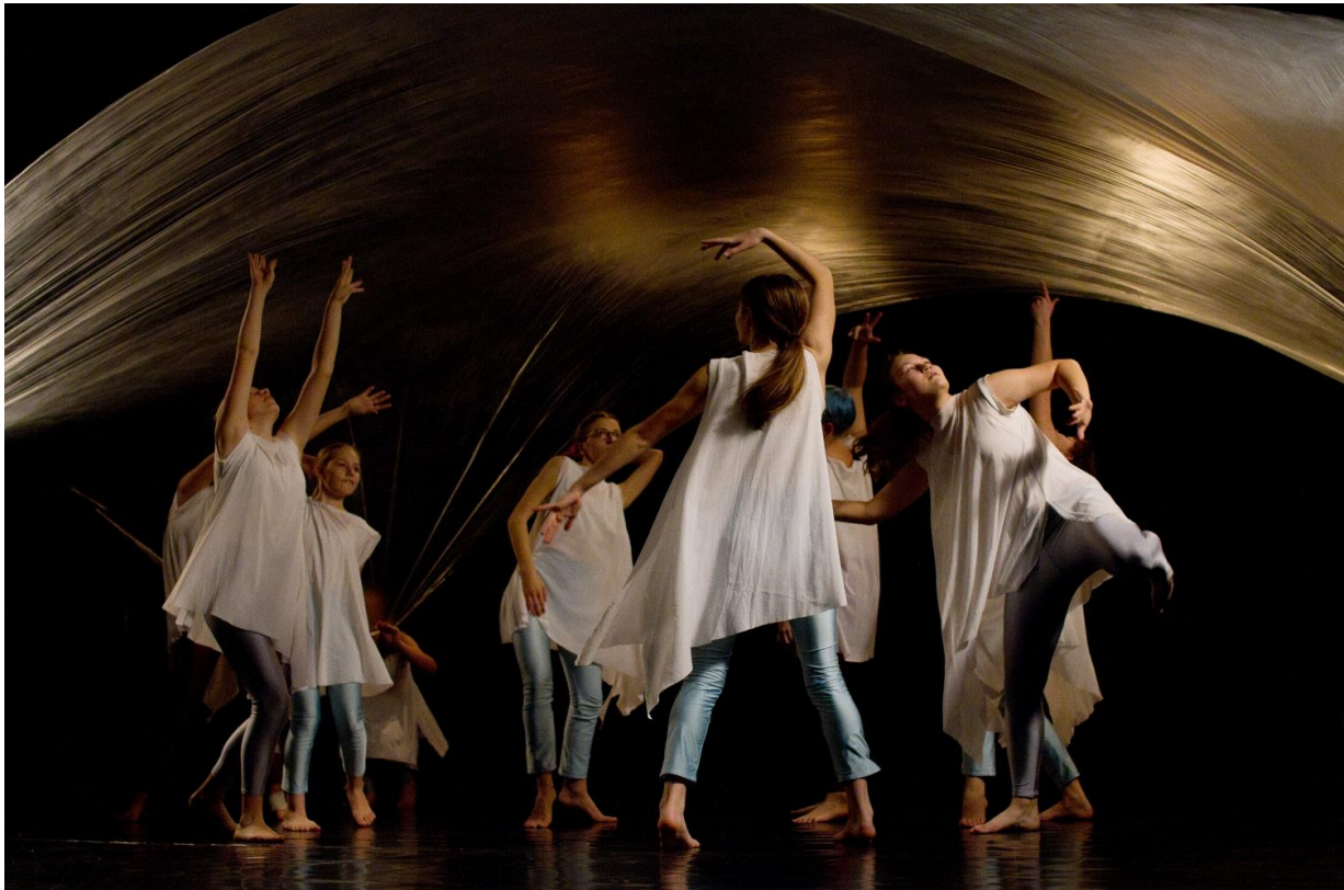
Taneční vánočka 3. 12. 2021 – vystoupení žáků tanečního oboru v divadle BARKA